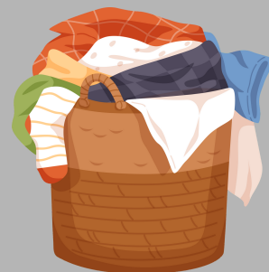
Telas contaminadas (ropa de cama, toallas, ropa, etc.)