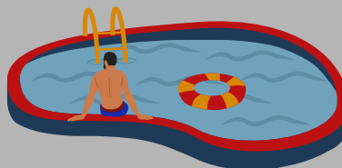
La Natación (piscinas y jacuzzis)