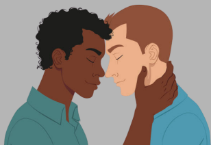
Otros contactos íntimos* (abrazar, besar, caricias, masajear, etc.)