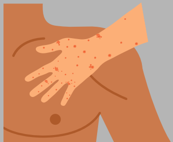
Contacto de piel a piel