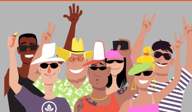
Asistir a eventos abarrotados en espacios interiores con personas que no están completamente vestidas