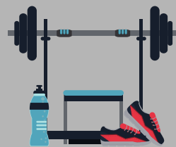
Hacer ejercicio en el gimnasio