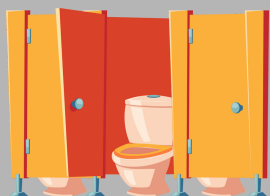
Uso de las instalaciones de los baños públicos