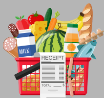
Compras de comestibles